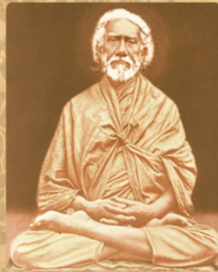
SWAMI SHRIYUKTESHWAR GIRI