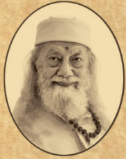
PARAMAHAMSA HARIHARANANDA (1907-2002)

Erfüllt von Reinheit und Liebe, kam er von einer ununterbrochenen Meisterlinie. Paramahansa Hariharananda erreichte Nirvikalpa Samadhi, den Zustand ohne Puls und Atem und der höchsten Glückseligkeit. Er war ein direkter Schüler von Swami Shriyuktेशwarji und Paramahansa Yoganandaji. Dieser verwirklichte Yogi verbreitete die Lehre des Kriya Yoga in Indien und der ganzen Welt.