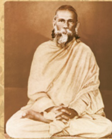
SWAMI SATYANANDA GIRI